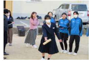
人権交流事業:ふれあい交流活動 (左:百人一首)(中:ソフトボール)(右:モルック)